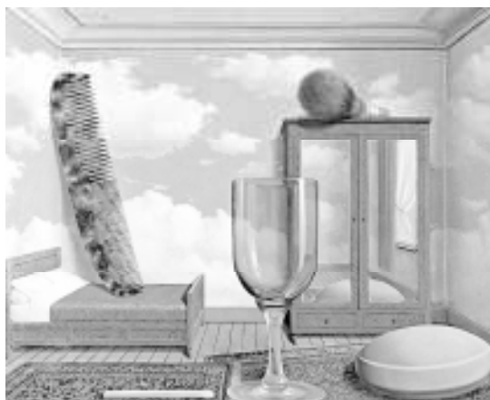
«ارزش‌های شخصی» اثر رنه ماگريت

«ماگريت» خود، روش‌های خویش را برشمرده است: «قرار دادن اشیاء در جاهای غیرعادی، آفریدن اشیای تازه، تغییر شکل اشیای آشنا، عوض کردن مادهٔ اشیاء، به کار بردن کلمه و تصویر با هم ...».