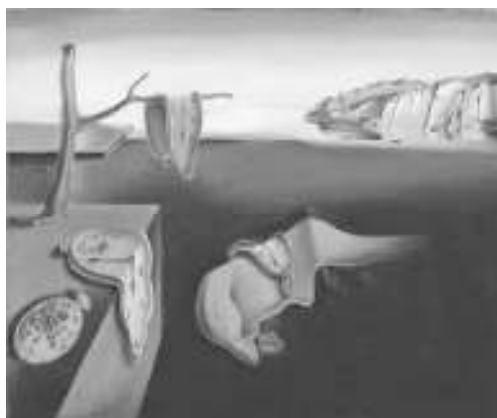
«استمرار خاطره» اثر سالوادور دالی

«دالی» در این باره می‌گوید: «زمانی که نقاشی‌هایم را می‌کشم، خود نمی‌فهمم چه معنایی می‌دهد، اما این دلیل بر بی‌معنایی آن‌ها نیست.» (دوشان ۹۳)